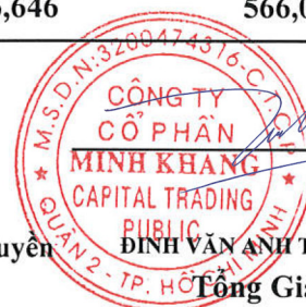
Tổng Giám đốc