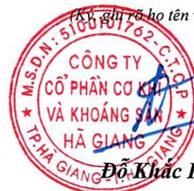
Đỗ Khắc Hùng