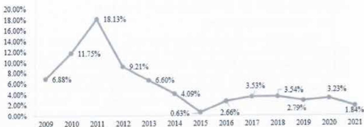
Hình 2: Tỷ lệ lạm phát qua các năm

Rủi ro lạm phát tăng sẽ dẫn đến tăng chi phí sản xuất kinh doanh trong khi giá hàng hoá lại bị ảnh hưởng bởi nhu cầu thị trường. Từ năm 2015 trở lại đây tỷ lệ lạm phát của Việt Nam tương đối ổn định, duy trì ở mức thấp: lạm phát duy trì dưới mức 4%, do chỉ đạo, điều hành của Chính phủ.