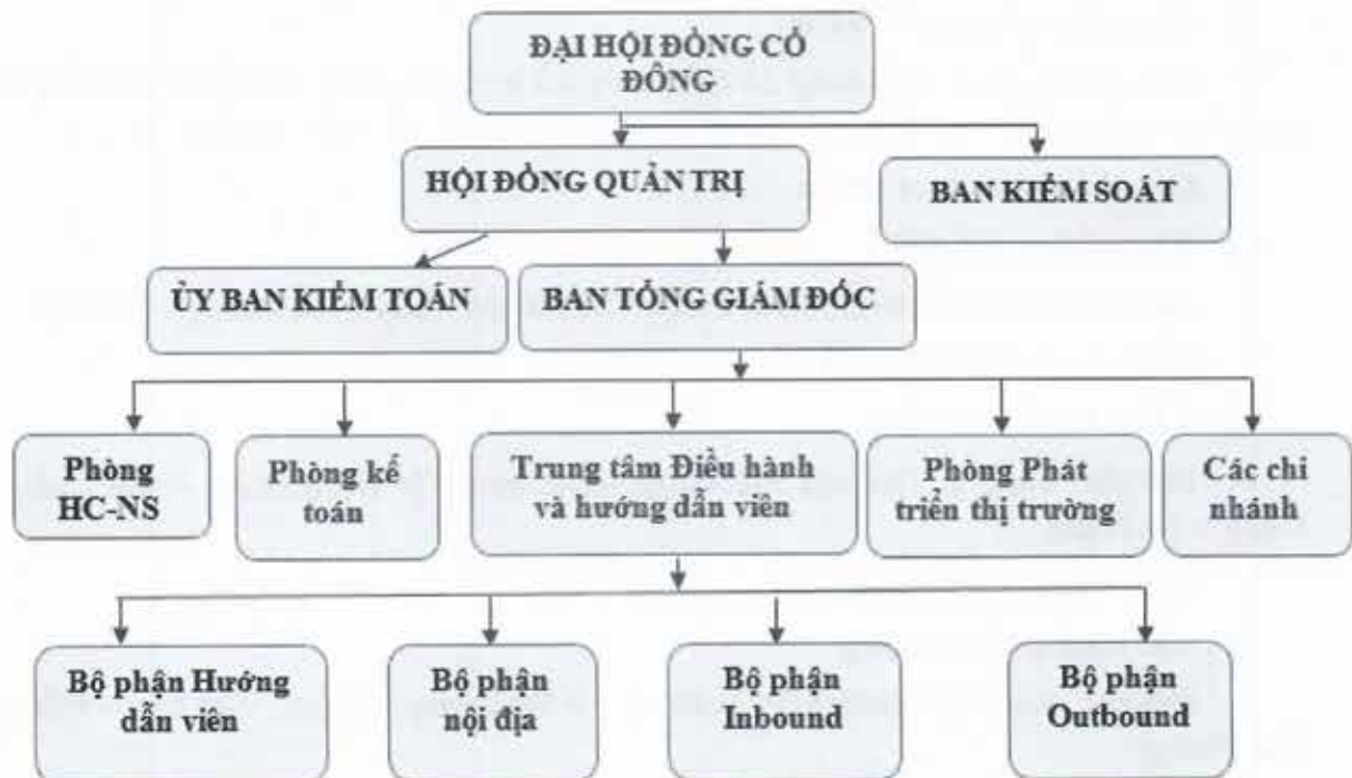
Hình 4. Cơ cấu quản trị và bộ máy quản lý của Công ty