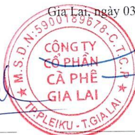
TRỊNH ĐÌNH TRƯỜNG Chủ tịch hội đồng quản trị