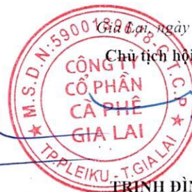
TRỊNH ĐÌNH TRƯỜNG