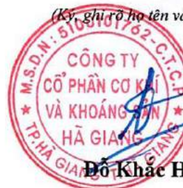
Đỗ Khắc Hùng