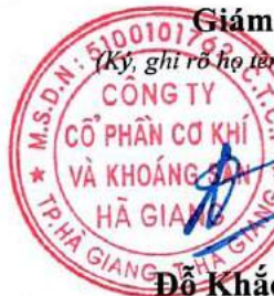
Đỗ Khắc Hùng