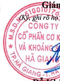
Đỗ Khắc Hùng