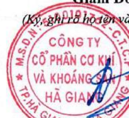
Đỗ Khắc Hùng