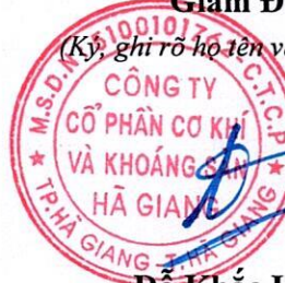
Đỗ Khắc Hùng