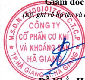
Đỗ Khắc Hùng