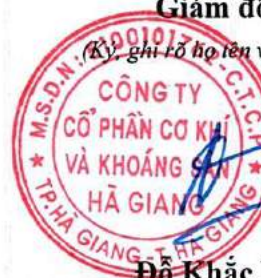
Đỗ Khắc Hùng