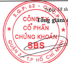
DƯƠNG MẠNH HÙNG