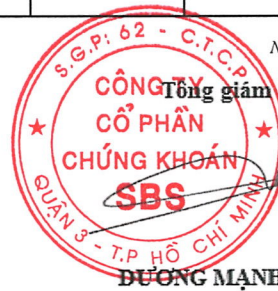
DƯƠNG MẠNH HÙNG