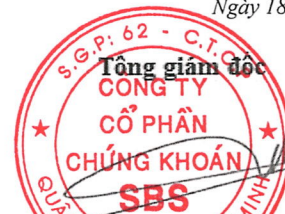
DƯƠNG MẠNH HÙNG