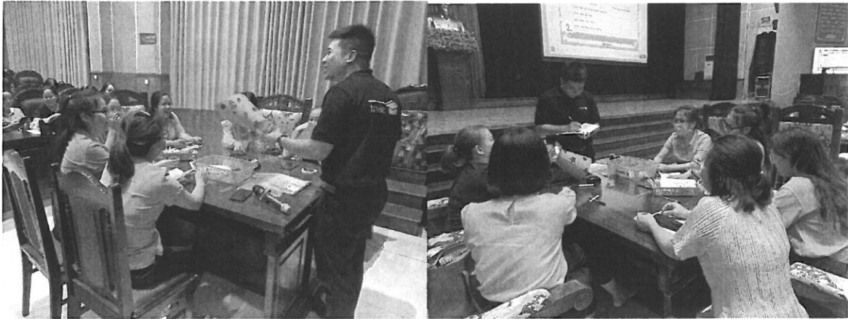
Một số hình ảnh Trí Việt tập huấn cho giáo viên tại các tỉnh

Từ đây, giáo viên sẽ không phải loay hoay soạn giáo án với bài giảng STEM vì toàn bộ Giáo án, bài giảng trình chiếu, video, phiếu học tập và đánh giá đã được tích hợp ở cùng một nơi. Việc tổ chức bài giảng STEM sẽ trở nên dễ dàng hơn bao giờ hết khi công cụ, dụng cụ và học liệu được cung cấp sẵn, giáo viên không cần phải mất thời gian chuẩn bị. Đối với học sinh, các con sẽ được tham gia vào những dự án thú vị và tự do sáng chế ra những sản phẩm STEM để giải quyết những vấn đề trong cuộc sống. Đối với nhà trường, ngoài việc thực hiện đúng chỉ đạo về chương trình Giáo dục STEM của Bộ Giáo dục, nhà trường còn triển khai được các hoạt động giáo dục trải nghiệm thông qua việc triển khai các Ngày hội STEM, các cuộc thi STEM cấp trường, giúp học sinh học thông qua trải nghiệm, ứng dụng sâu sắc giáo dục trải nghiệm vào học tập và cuộc sống.