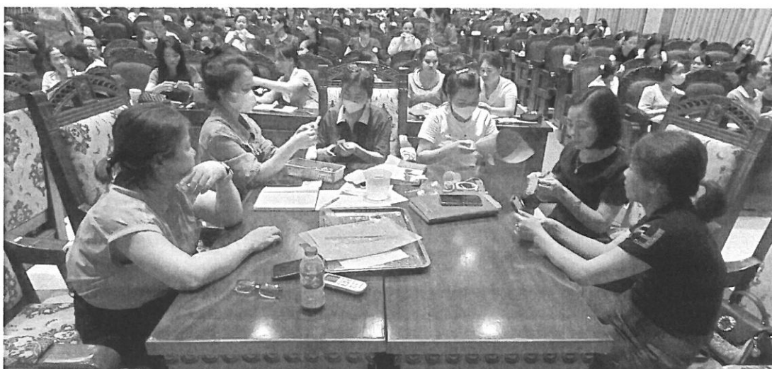
Giáo viên thực hành sử dụng học liệu của chương trình STEM

Chương trình STEM Số hóa do Trí Việt phát triển có nhiều ưu điểm như bám sát khung nội dung “Chương trình GDPT mới” Bộ GD &ĐT, đồng thời cũng trải qua quá trình thẩm định gắt gao của hội đồng Khoa Học Tâm lý Việt Nam. Đặc biệt, học liệu trong chương trình được số hóa tích hợp vào hệ thống quản lý nội dung (CMS), theo định kỳ, học liệu sẽ được chuyển đến trường theo lộ trình học. Ngoài ra, ứng dụng Web – App Hacking STEM Trí Việt hỗ trợ học sinh rèn luyện tại nhà và kết nối với nhà trường, giáo viên, phụ huynh và học sinh trong toàn bộ tiến trình học.