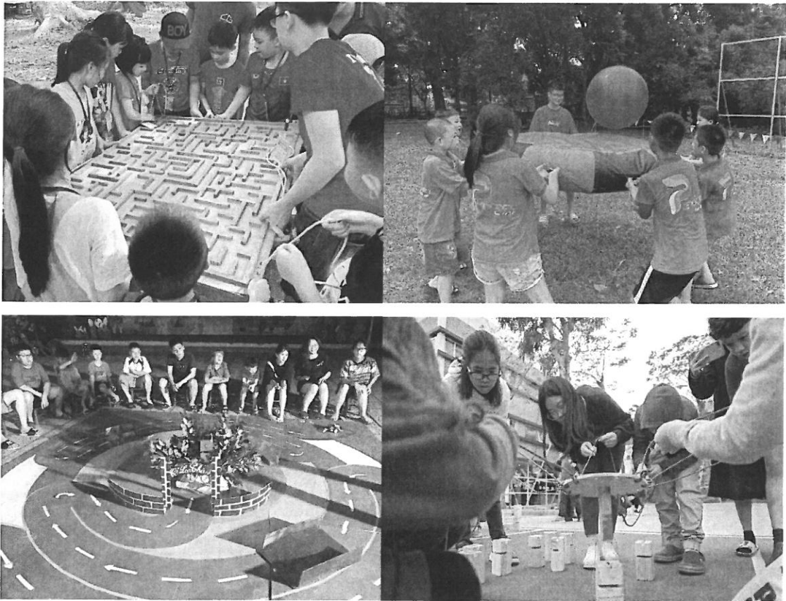
Một số hình ảnh bộ học liệu, giáo cụ