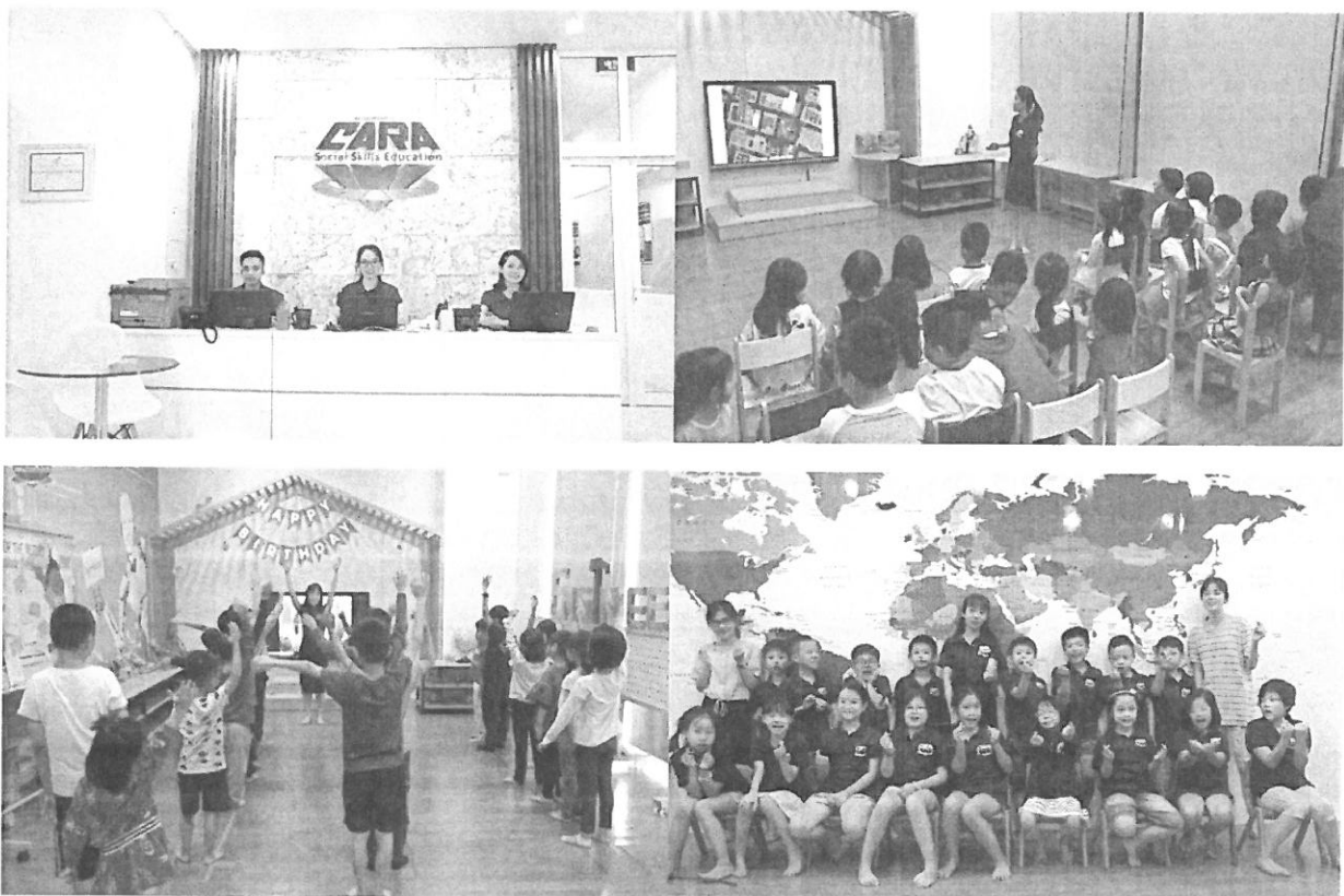
Một số hình ảnh tại Hệ thống trung tâm giáo dục kỹ năng sống CARA

Để chủ động trong quá trình chuẩn bị và triển khai, Công ty đồng thời sẽ tiến hành các thủ tục cần thiết theo quy định để mở mới Trung tâm đào tạo các chương trình giáo dục kỹ năng sống, giáo dục STEM tại các địa điểm được lựa chọn.