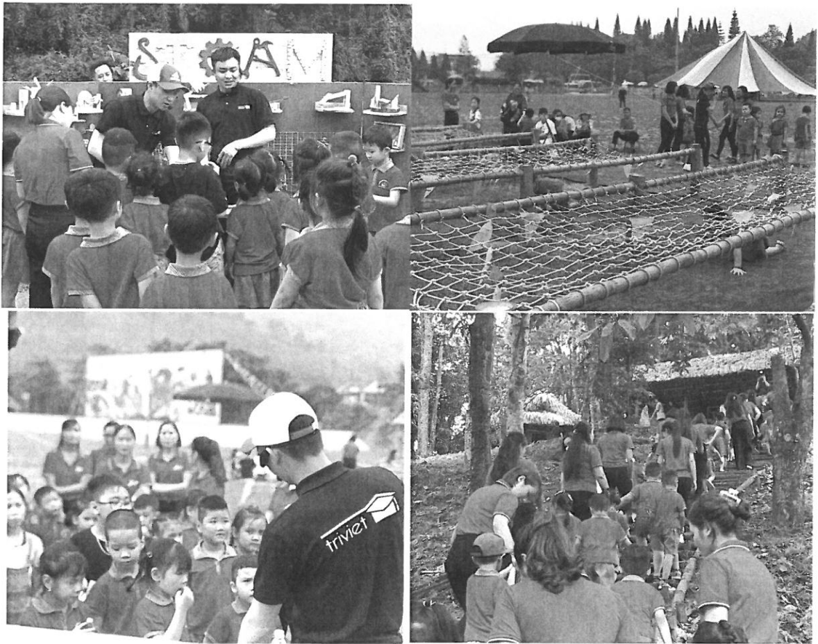
Hình 6: Một số hình ảnh cung cấp giáo dục trải nghiệm tại các cơ sở giáo dục các tỉnh