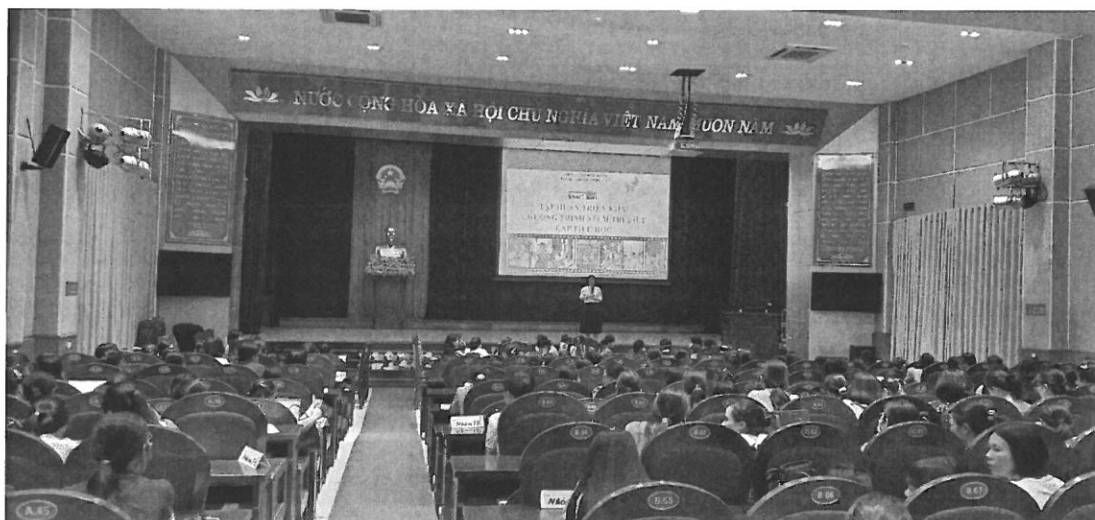
Tập huấn triển khai chương trình STEM Trí Việt cấp tiểu học cho toàn bộ giáo viên tiểu học huyện Bình Xuyên, Vĩnh Phúc

Chương trình STEM Số hóa do Trí Việt phát triển có nhiều ưu điểm như bám sát khung nội dung “Chương trình GDPT mới” Bộ GD &ĐT, đồng thời cũng trải qua quá trình thẩm định gắt gao của hội đồng Khoa Học Tâm lý Việt Nam. Đặc biệt, học liệu trong chương trình được số hóa tích hợp vào hệ thống quản lý nội dung (CMS), theo định kỳ, học liệu sẽ được chuyển đến trường theo lộ trình học. Ngoài ra, ứng dụng Web – App Hacking STEM Trí Việt hỗ trợ học sinh rèn luyện tại nhà và kết nối với nhà trường, giáo viên, phụ huynh và học sinh trong toàn bộ tiến trình học.