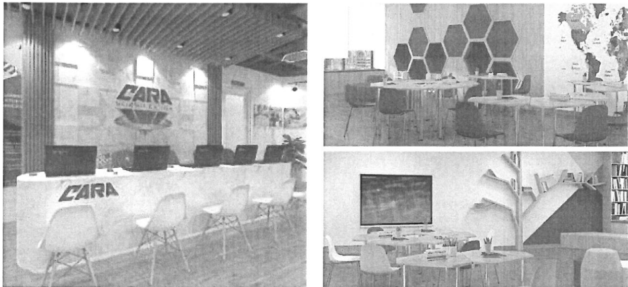
Hình 5: Hình ảnh về các trung tâm tại hệ thống giáo dục CARA

Việc mở rộng hoạt động kinh doanh của Công ty ra các tỉnh thành đòi hỏi sự phát triển đồng bộ về nhân sự cũng như cơ sở vật chất không chỉ để phục vụ các chương trình giảng dạy của Công ty mà còn tăng nhận diện thương hiệu tại khu vực. Hệ thống giáo dục CARA gồm 02 trung tâm tại Hà Nội và 01 trung tâm tại Thái Nguyên đã được Trí Việt xây dựng theo tiêu chuẩn quốc tế, dễ dàng đóng gói và phát triển tại các địa phương.