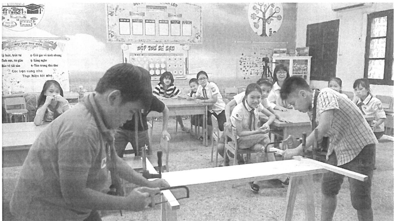
Trí Việt Demo bài giảng STEM mẫu cho học sinh và giáo viên tại tỉnh Phú Thọ

Từ đây, giáo viên sẽ không phải loay hoay soạn giáo án với bài giảng STEM vì toàn bộ Giáo án, bài giảng trình chiếu, video, phiếu học tập và đánh giá đã được tích hợp ở cùng một nơi. Việc tổ chức bài giảng STEM sẽ trở nên dễ dàng hơn bao giờ hết khi công cụ, dụng cụ và học liệu được cung cấp sẵn, giáo viên không cần phải mất thời gian chuẩn bị. Đối với học sinh, các con sẽ được tham gia vào những dự án thú vị và tự do sáng chế ra những sản phẩm STEM để giải quyết những vấn đề trong cuộc sống. Đối với nhà trường, ngoài việc thực hiện đúng chỉ đạo về chương trình Giáo dục STEM của Bộ Giáo dục, nhà trường còn triển khai được các hoạt động giáo dục trải nghiệm thông qua việc triển khai các Ngày hội STEM, các cuộc thi STEM cấp trường, giúp học sinh học thông qua trải nghiệm, ứng dụng sâu sắc giáo dục trải nghiệm vào học tập và cuộc sống.