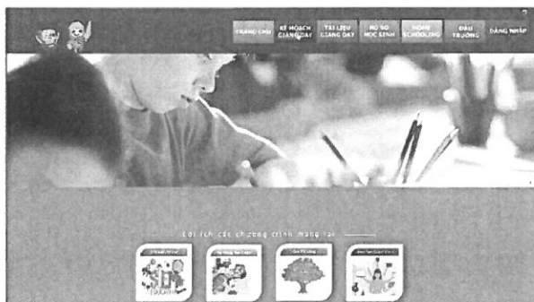
Hệ thống CMS