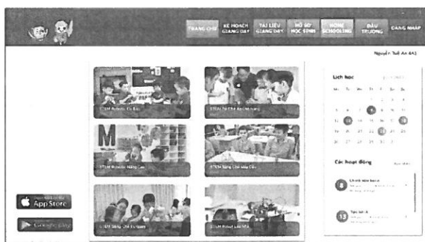
Kho học liệu số hóa