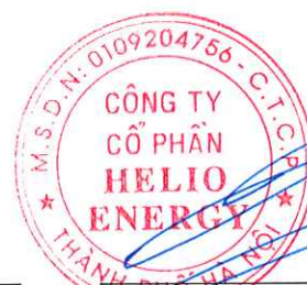
Phan Thành Đạt Chủ tịch Hội đồng quản trị