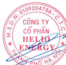
Phan Thành Đạt Chủ tịch Hội đồng quản trị