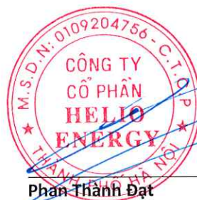
Phan Thành Đạt Chủ tịch Hội đồng quản trị