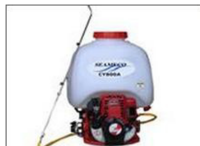
Máy phun thuốc