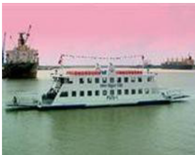
Tàu du lịch, tàu khách