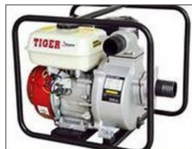
Máy xăng Máy cắt cỏ Máy bơm nước