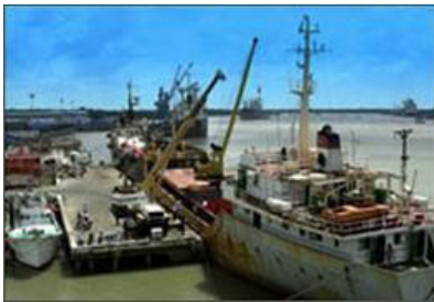
Dịch vụ cầu cảng