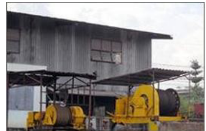
Dịch vụ lên xuống xà lan