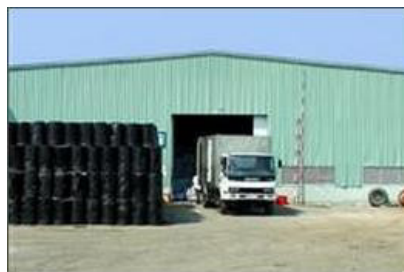
Dịch vụ kho bãi