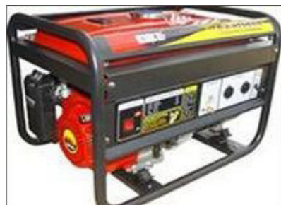
Máy phát điện