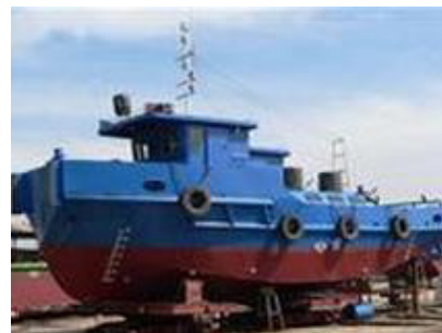
Tàu vỏ thép