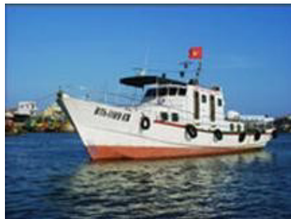
Tàu tuần tra, kiểm ngư