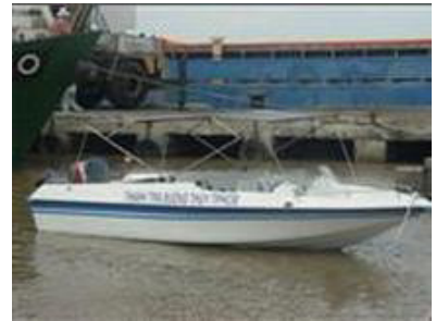
Cano Composite cao tốc