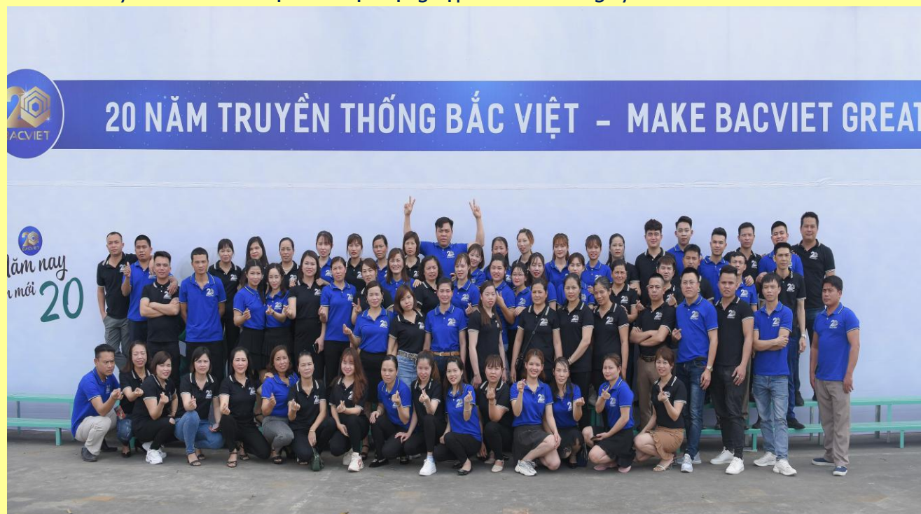
(Tập thể CBCNV tham dự 20 năm truyền thống Bắc Việt năm 2020)

Dưới đây là hình ảnh một số hoạt động tập thể của Công ty.