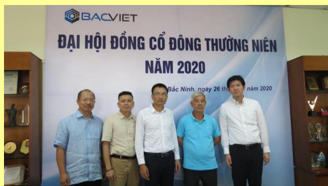
Hội đồng quản trị tại Đại hội đồng cổ đông thường niên năm 2020