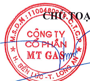
TRƯƠNG HỮU PHƯỚC