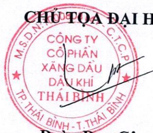
Đoàn Duy Công