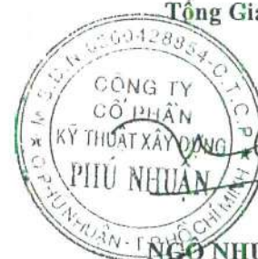
NGÔ NHƯ HÙNG