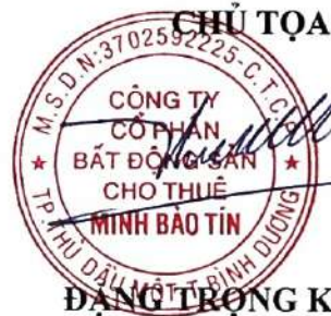
ĐANG TRỌNG KHANG