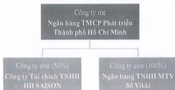
Hình 1: Cơ cấu tổ chức của HDBank