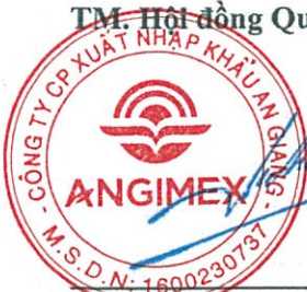
Lương Đức Tâm Chủ tịch Hội đồng Quản trị