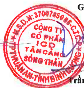
Trần Trí Dũng