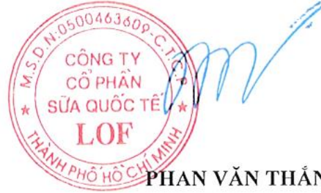
PHAN VĂN THẮNG

(Ký, ghi rõ họ tên, chức vụ, đóng dấu) (Signature, full name, position, and seal)