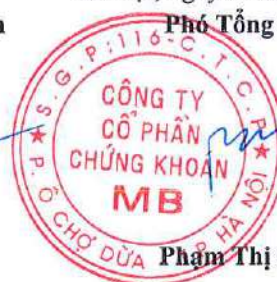
Phạm Thị Kim Ngân