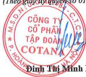
Đinh Thị Minh Hằng

(Các thuyết minh từ trang 11 đến trang 42 là bộ phận hợp thành của Báo cáo tài chính riêng này)