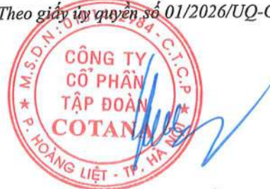
Đinh Thị Minh Hằng

(Các thuyết minh từ trang 11 đến trang 42 là bộ phận hợp thành của Báo cáo tài chính riêng này)