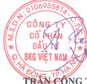
TRẦN CÔNG THÀNH