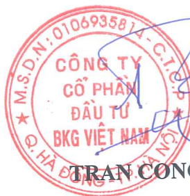
TRẦN CÔNG THÀNH