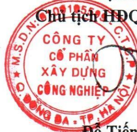
Đỗ Tiến Lợi