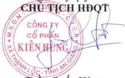
Trần Quốc Hùng