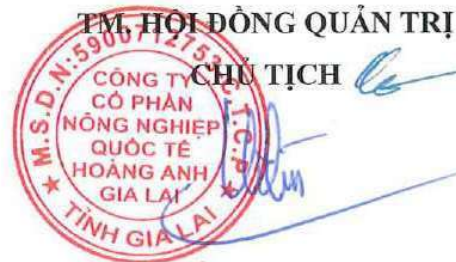
Trần Bá Dương

Trên đây là Báo cáo của HĐQT về công tác quản trị điều hành hoạt động kinh doanh năm 2025. Hội đồng quản trị kính trình trình Đại hội đồng cổ đông xem xét, thông qua và đóng góp ý kiến để HĐQT nâng cao trách nhiệm quản trị nhằm thực hiện tốt nhiệm vụ và góp phần xây dựng Công ty phát triển theo định hướng và chiến lược đã đề ra.