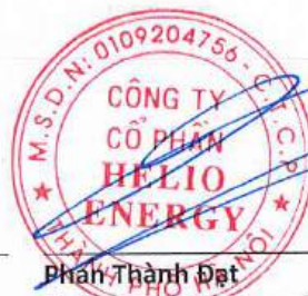
Phan Thành Đạt Chủ tịch Hội đồng quản trị