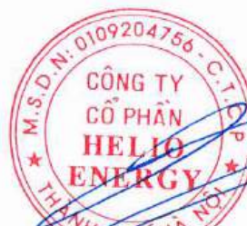
Phan Thành Đạt Chủ tịch Hội đồng quản trị