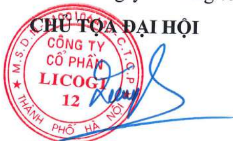
Dương Xuân Quang

Trên đây là kết quả hoạt động của Ban kiểm phiếu tại Đại hội đồng cổ đông lần thứ 22 năm 2026 Công ty cổ phần LICOGI 12. Biên bản kiểm phiếu gồm 02 trang, được lập xong vào hồi 11h30 ngày 06 tháng 05 năm 2026 và đã được thông qua trước Đại hội.