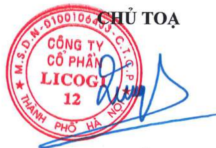
DƯƠNG XUÂN QUANG