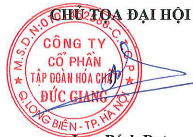
Lưu Bách Đạt