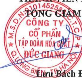
Lưu Bách Đạt