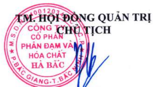
Nguyễn Văn Thiệu