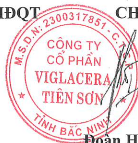
Đoàn Hải Mậu