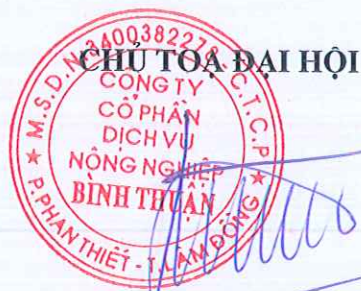
LƯU XUÂN ĐỖ