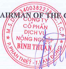
LUU XUAN DO