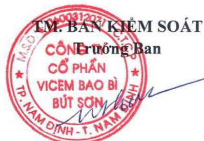
Trần Đức Thiện

Trên đây là toàn bộ báo cáo hoạt động của Ban Kiểm soát năm 2025, kính trình Đại hội đồng cổ đông xem xét và thông qua.