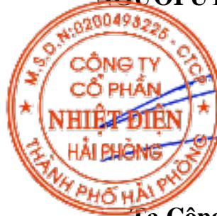
Tạ Công Hoan Chủ tịch Hội đồng quản trị Công ty Cổ phần Nhiệt điện Hải Phòng