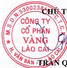
TRẦN QUANG ĐĂNG