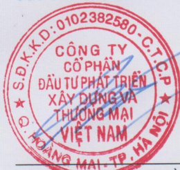
PHẠM HUY THÀNH Chủ tịch hội đồng quản trị

Các báo cáo tài chính này được phê chuẩn để phát hành ngày 19 tháng 07 năm 2018