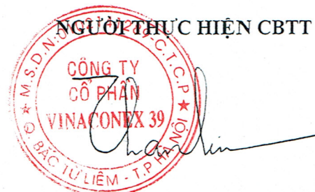
Vũ Thành Kiên