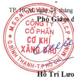
Hồ Trí Lượng