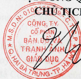
Phan Xuân Thành