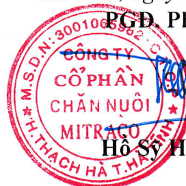
Hồ Sỹ Huy Thảo