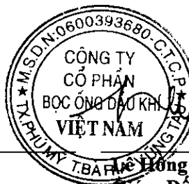
Ac Hong Hai Giám Đốc