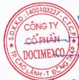
TRẦN HỮU HIỆP