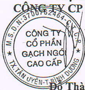
Đỗ Thành Lộc