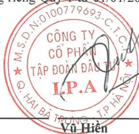
Vũ Hiền Chủ tịch Hội đồng quản trị Hà Nội, ngày 26 tháng 04 năm 2019