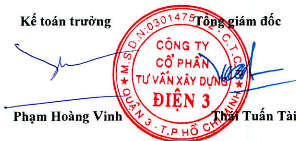
Thái Tuấn Tài