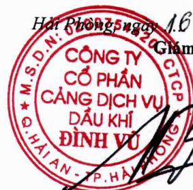
Đặng Kiên Nghiệp