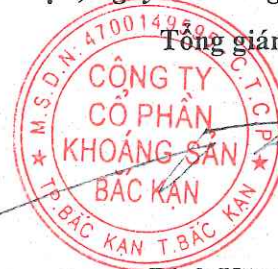
Đình Văn Hiến