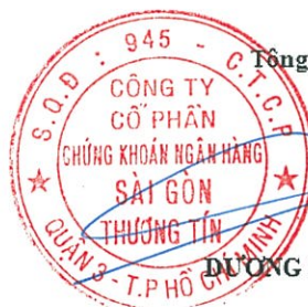
DƯƠNG MẠNH HÙNG