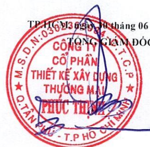
TỔ KHAI ĐẠT