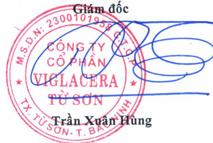
Trần Xuân Hùng