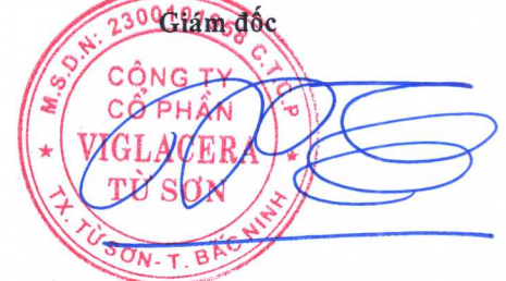
Trần Xuân Hùng