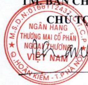
Nghiêm Xuân Thành